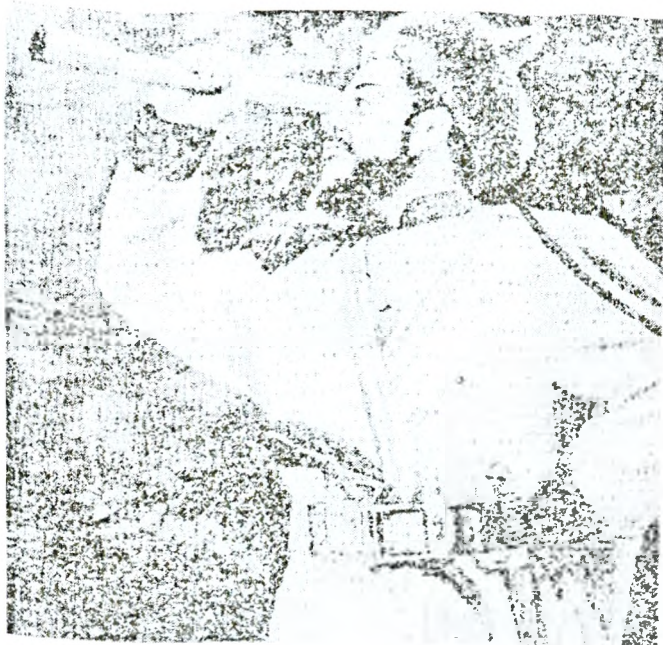
Каһым түрә ролендә Арыслан Мобәрәков.