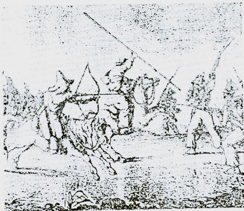
Башкорттар I Ватан һугышында