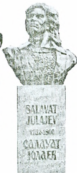
Салауат Юлаев һәйкәле. Эстония. Палдиски калаһы.