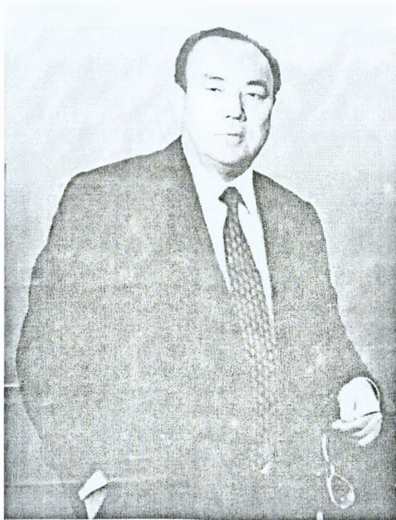
Муртаза Рәхимов - Башкортостандың президенты.

автономия фикцияға, ә Мәскәү - автономияларҙы үз тырнағында тоткан һөлөк-үзәккә әйләнә.